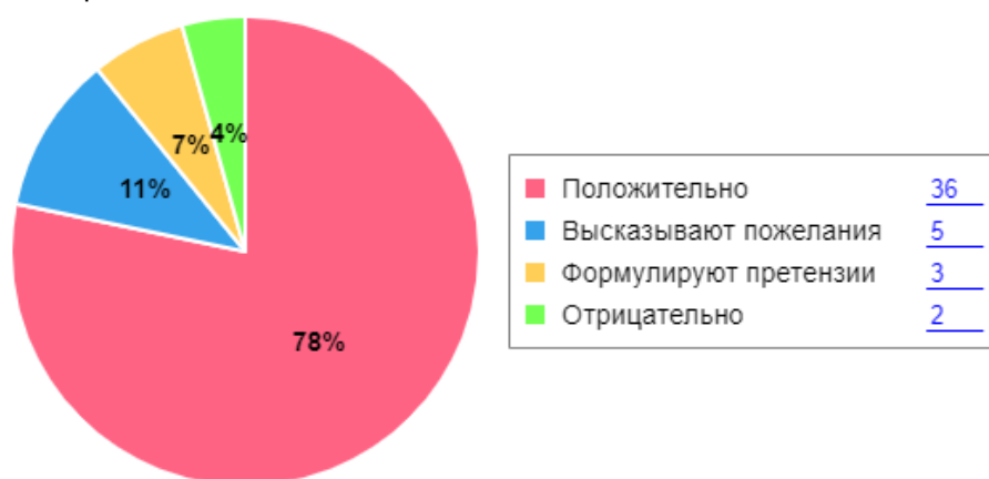
Таблица 15. Результаты анализа показателей деятельности организации

Общие результаты по итогам оценки уровня удовлетворенности родителей представлены в гистограмме ниже.